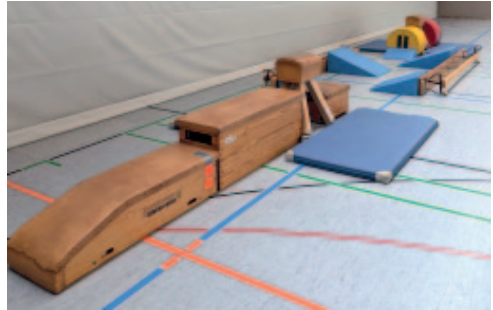
Beispielhafter Aufbau für eine Turnstunde