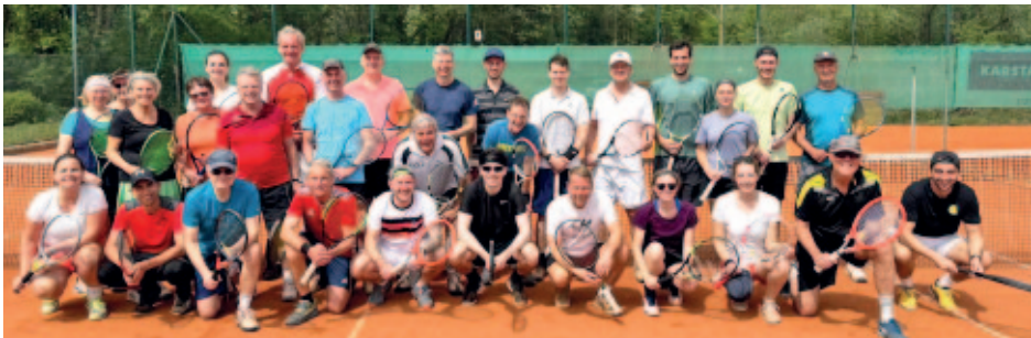
Ein voller Erfolg: unser Doppelturnier