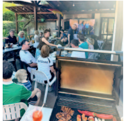
Beim EM-Gucken war die Versorgung durch den neuen Grill sichergestellt

Wir hoffen, dass wir über den Herbst und Winter weitere Trainer:innen finden, die Spaß und Lust am Sport und Training von Kindern, Jugendlichen und Erwachsenen haben. Bei Interesse wendet euch