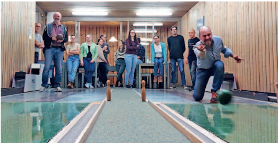
Weihnachtsfeier beim Kegeln im Pfarrheim