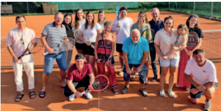
Teilnehmer:innen des Mixed Turniers